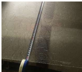
既存ガラス大きさ