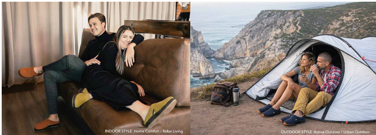
INDOOR STYLE Home Comfort / Relax Living

インドアからアウトドアまで日常のあらゆるシーンにフィットし、日常の快適性を足元から支えます。