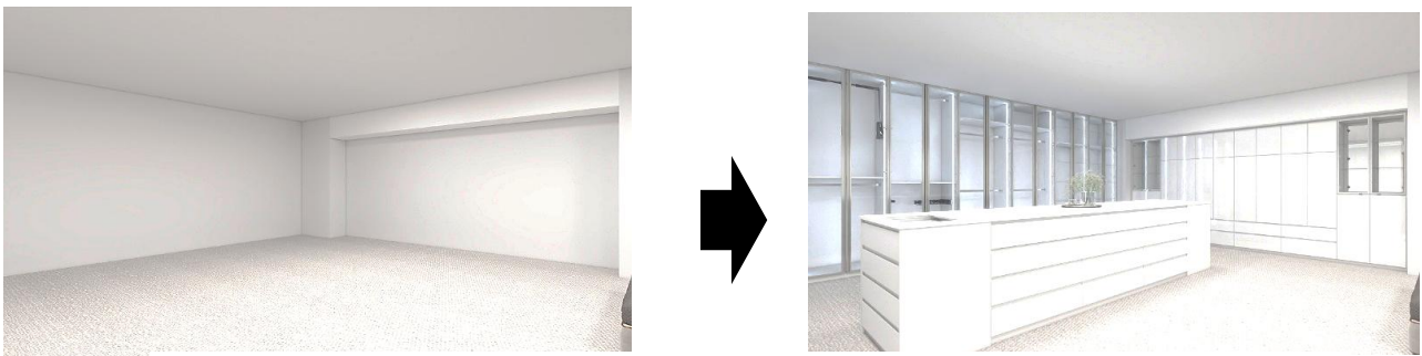
[広さは変わらない。価値は変わる。収納設計で、住まいの価値は再定義される]

狭小化が進む住宅市場において、資産価値と居住満足度を両立させる、新たな住まいの価値基準を提示します。