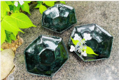
林源太 『乾漆六角銘々皿』