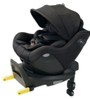
ショコラブラック BK