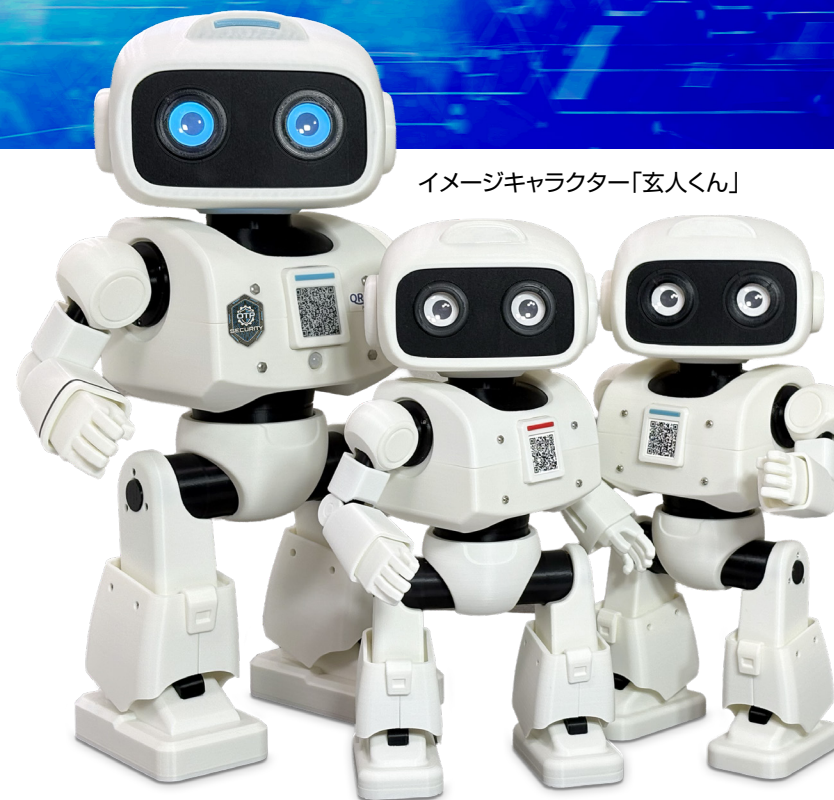
イメージキャラクター「玄人くん」