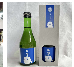
パッケージのアイコン

実際の活用例はこちらからご確認いただけます。【 https://nagasakiohen.jp/nekochara_use/ 】