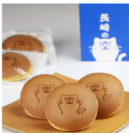
商品の販促キャラ