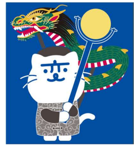
「にゃーが」フリーダウンロード素材(一部)