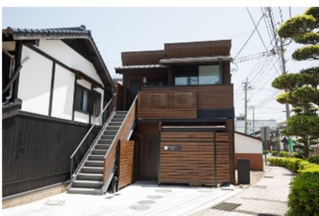
<SHIOSAI HIRADO 外観>