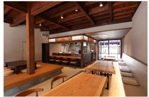
<旬楽 碧衣(1F) 内観>