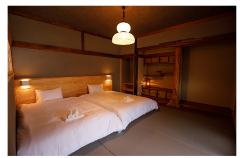
<SHIOSAI HIRADO 内観>