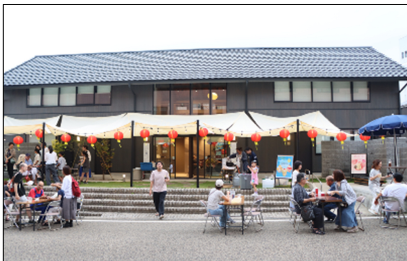
The 曜 Terrace 広場でのイベントの様子(令和7年7月19～20日)