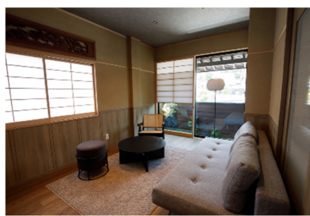
<SHIOSAI HIRADO 内観>