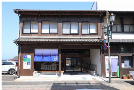
<旬楽 碧衣(1F)、陣屋 碧(2F)外観>