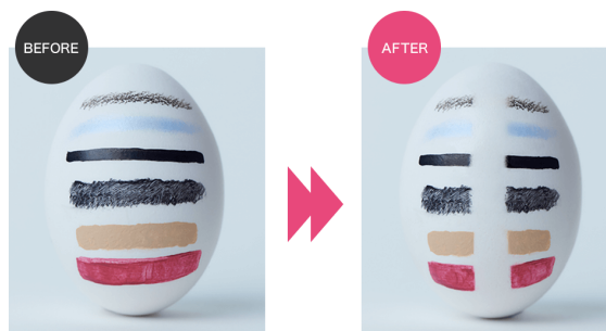
クレンジング ビフォーアフター

すばやくなじんで毛穴の奥まで届くなめらかなオイルが、ハードなメイクはもちろん、余分な皮脂や肌をザラつかせる角栓まで、スムーズに浮き上がらせます。オイルでありながら水分と融合し、メイクや汚れを包み込んだオイルは、水ですっきりと洗い流せ、さっぱりとした使用感です。