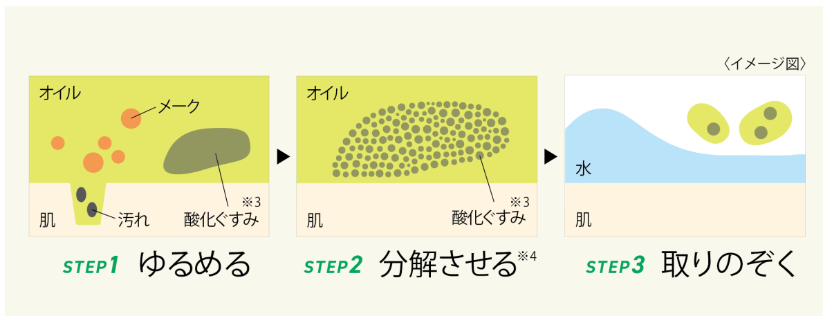
クレンジングの3ステップ イメージ図