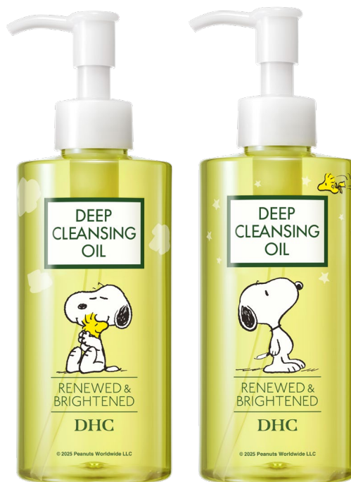
左から、[スヌーピー]キュート、[スヌーピー]スター

※2: 1995 年 12 月～2024 年 12 月末日までのシリーズ総販売個数 (サイズ違い、コラボ品等を含む)