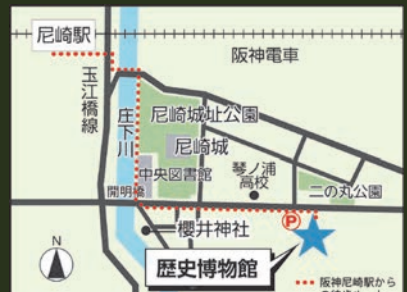
阪神電車尼崎駅から南東へ徒歩約10分

3階の展示学習室では企画展「110年前の尼崎と現在」を開催中です。こちらぜひご覧ください。