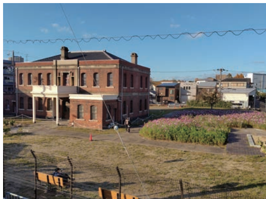
建物と敷地(昨冬のコスモス開花頃)

明治33年(1900)、尼崎紡績本社工場の南西角に煉瓦造2階建の本社事務所が建設されました。昭和20年(1945)6月の空襲で大日本紡績尼崎工場は焦土と化し、ほぼ唯一残ったこの建物は、昭和34年(1959)に日紡記念館(後にユニチカ記念館)として一般公開が開始されました。令和元年(2019)、老朽化を理由にユニチカ記念館は閉館となり、翌年には敷地の処分が検討されました。令和5年(2023)に尼崎市が取得し、以後、建物の応急修理を進めながら建物内部の見学会や敷地でのイベントを開催しています。令和7年(2025)からは敷地の常時公開を開始し、今年度は建物の構造基礎調査と敷地の緑化を進めます。