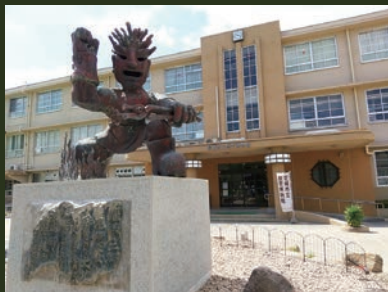
尼崎市立歴史博物館と前庭の鉄鋼戦士像(工業の神)