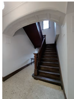
建物中央の木製階段