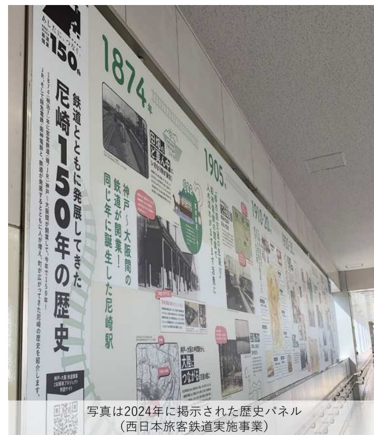
写真は2024年に掲示された歴史パネル （西日本旅客鉄道実施事業）