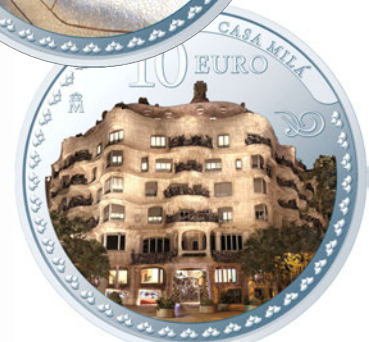
上/10ユーロカラー銀貨<グエル公園>裏面 下/10ユーロカラー銀貨<カサ・ミラ>裏面