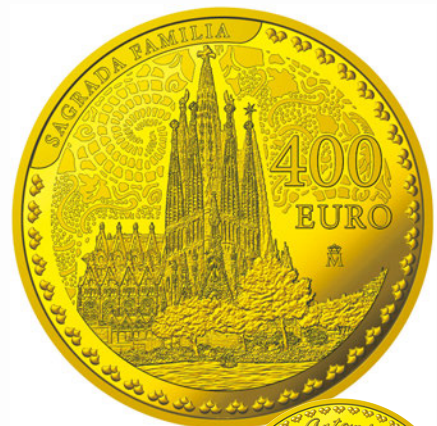
400ユーロ金貨<サグラダ・ファミリア> 裏面/表面

(注1)サグラダ・ファミリア贖罪聖堂建設委員会財団(Junta Constructora del Temple Expiatori de la Sagrada Família)の建築図面に基づき、王立スペイン造幣局がデザイン