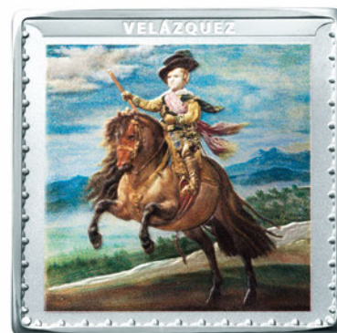
プラド美術館200周年記念コイン