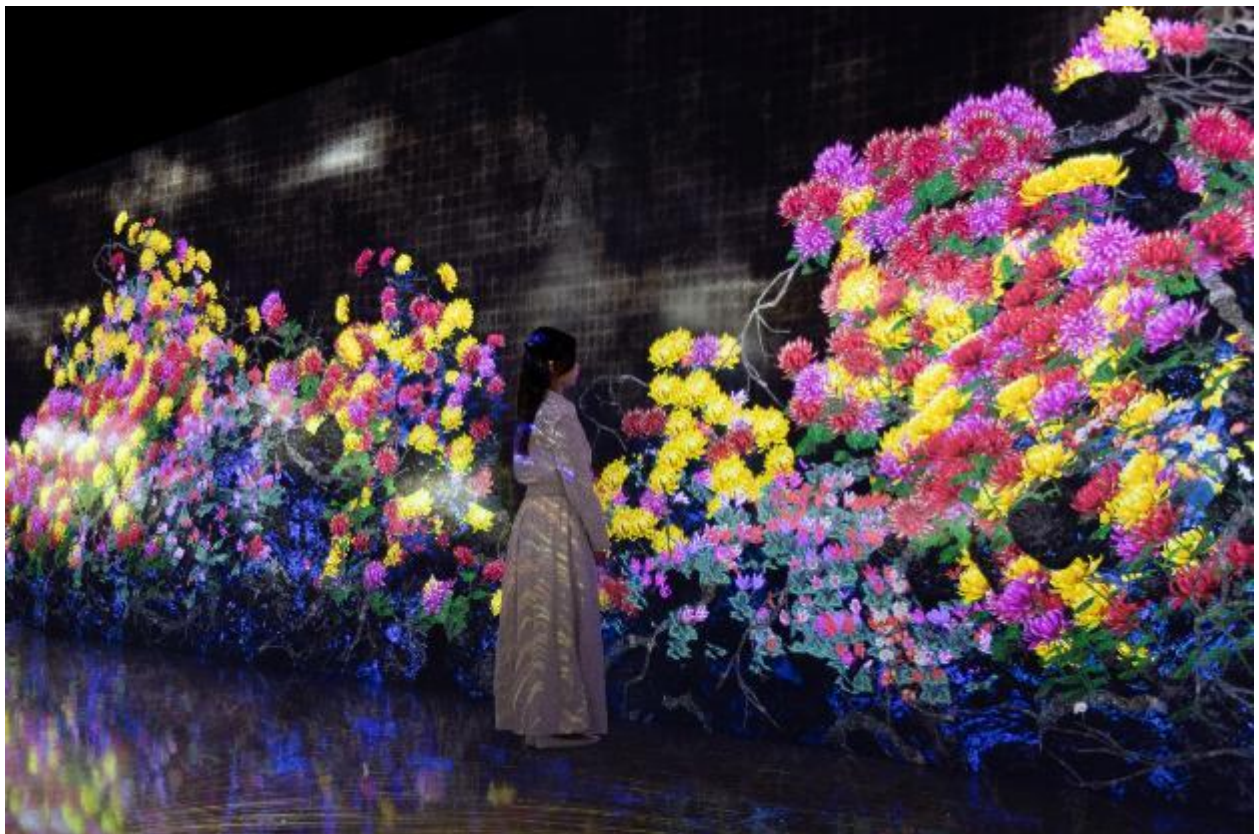
チームラボ《永遠の今の中で連続する生と死》© チームラボ ※参考画像

撮影した写真はGalaxy AI機能でより好みの写真に編集が可能です。体験の最後には作成した写真を4枚選んで1枚の画像を作成し、オリジナルシールをプレゼントいたします。