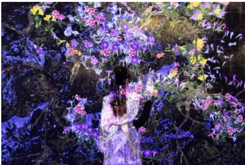
チームラボ《永遠の今の中で連続する生と死》※参考画像

花々が誕生と死滅を永遠に繰り返します。人々が触れると花々は散り、立ち止まっていると付近の花々は普段より多く生まれます。花々は、時間の流れと共に移り変わっていきます。