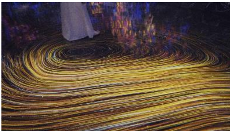
チームラボ《流れははるか遠くに》© チームラボ ※参考画像

人が動くと、そこに流れが生まれ、生まれた流れは全体にまで影響を及ぼします。他の人々の動きも流れを生み、流れは混じり合い、渦を生みます。渦は流れと共に変化していきます。人々が止まったり、いなくなると流れは、やがて消え、空間には何も存在しなくなります。