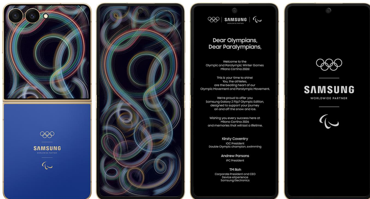
▲「Samsung Galaxy Z Flip7 Olympic Edition」スペシャル壁紙と起動画面

各デバイスには、ミラノ・コルティナ 2026 のために特別に制作された冬季オリンピック大会テーマの壁紙があらかじめ設定されています。スケートのブレードと氷面の接触によって生まれる軌跡から着想を得たカラフルな曲線は冬季競技を象徴するとともに、オリンピックの精神と競技にかける選手一人ひとりの情熱への称えを表しています。