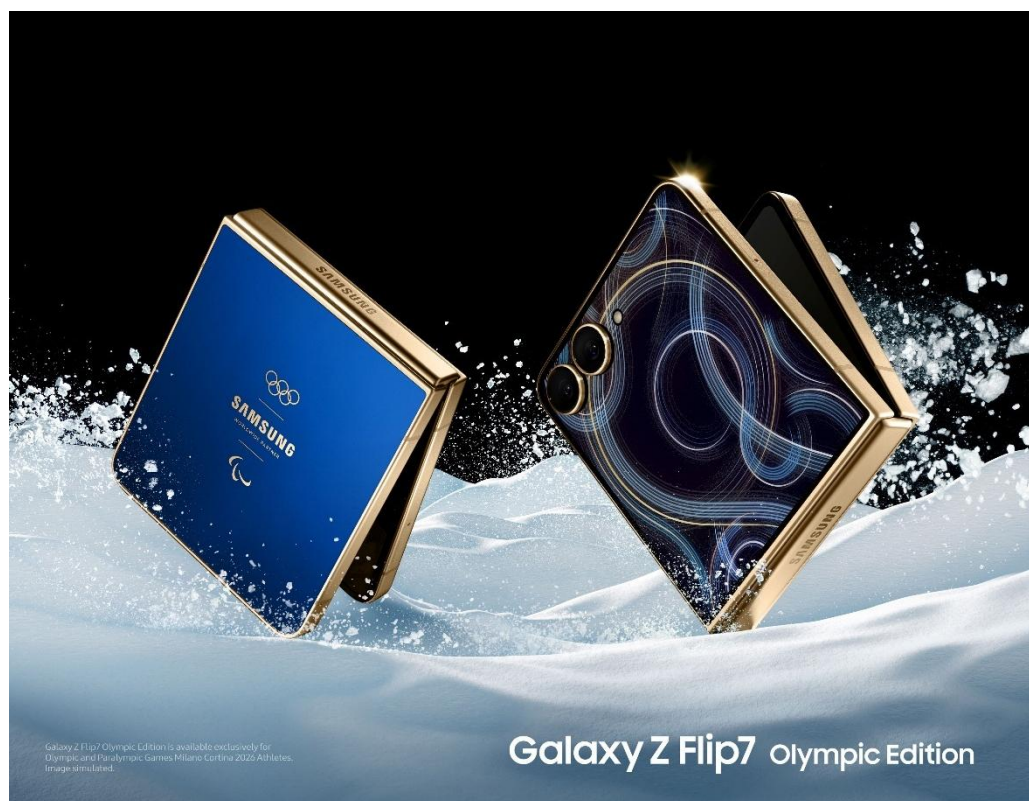
▲ミラノ・コルティナ 2026 「Samsung Galaxy Z Flip7 Olympic Edition」