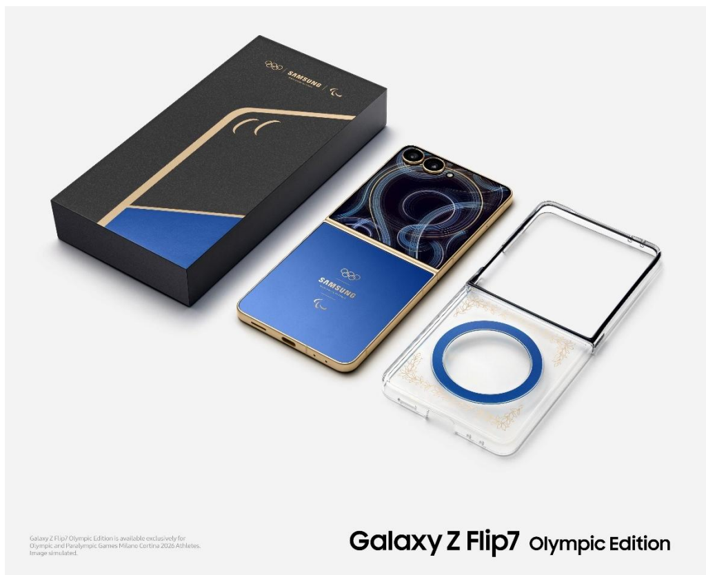
▲ 「Samsung Galaxy Z Flip7 Olympic Edition」のパッケージ

これらの機能に加え、「Samsung Galaxy Z Flip7 Olympic Edition」はオリンピック・パラリンピック冬季競技大会への出場を記念した特別デザインを採用し、さらに、選手村での生活や競技期間中の体験をより豊かにする実用的なサービスを提供します。