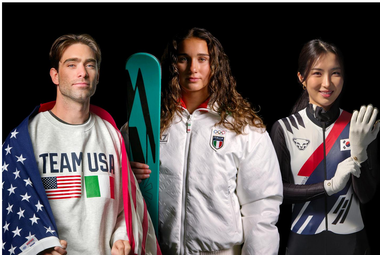
▲（左から）フリースタイルスキーヤーAlex Hall 選手、 Flora Tabanelli 選手、スピードスケート Gilli kim 選手

選手の歩みは、競技そのものとどまらず、日々の準備や高揚感、そしてミラノ・コルティナ 2026 を取り巻くさまざまな感情まで多岐にわたります。Samsung は、こうした選手の幅広いストーリーに光を当て、その体験を称えるため、9 つの国内オリンピック委員会 (NOC) と共同で、新たなアスリート・ストーリーテリングの取り組み「Victory Profile」を開始します。Victory Profile では、「Samsung Galaxy S25 Ultra」で撮影し、厳選されたポートレート画像を通じて、選手一人ひとりの情熱や個性を鮮やかに描きます。