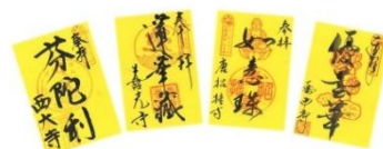
▲ロータスロード 期間限定特別御朱印 ※イメージ