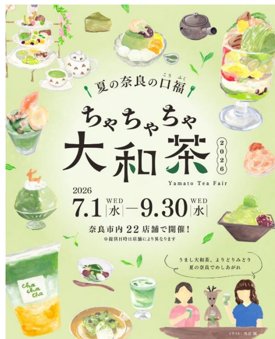
▲「ちゃちゃちゃ大和茶2026」 ※イメージ