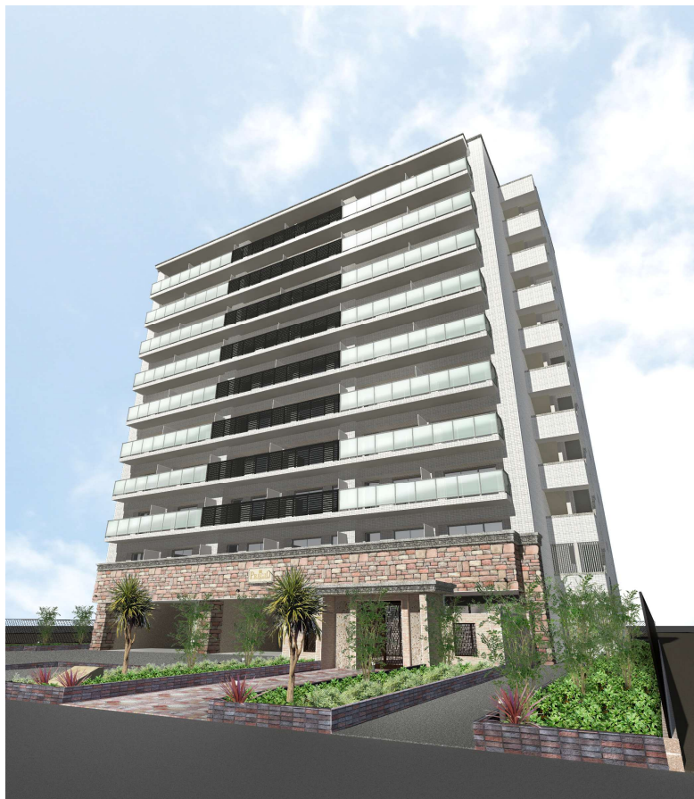
【外観 イメージパース】

当物件は、JR 東海道本線「塚本」駅を最寄りとし、物件から徒歩 12 分の距離に位置しています。「大阪」駅へは 1 駅でアクセス可能で、都心主要エリアへスムーズに移動できる利便性を備えています。西日本最大級のターミナル・梅田エリアを日常生活圏としながら、物件周辺にはスーパーマーケットやドラッグストアなどの生活利便施設が徒歩圏内に充実しています。都市の利便性と穏やかな住環境が調和した、魅力ある立地です。