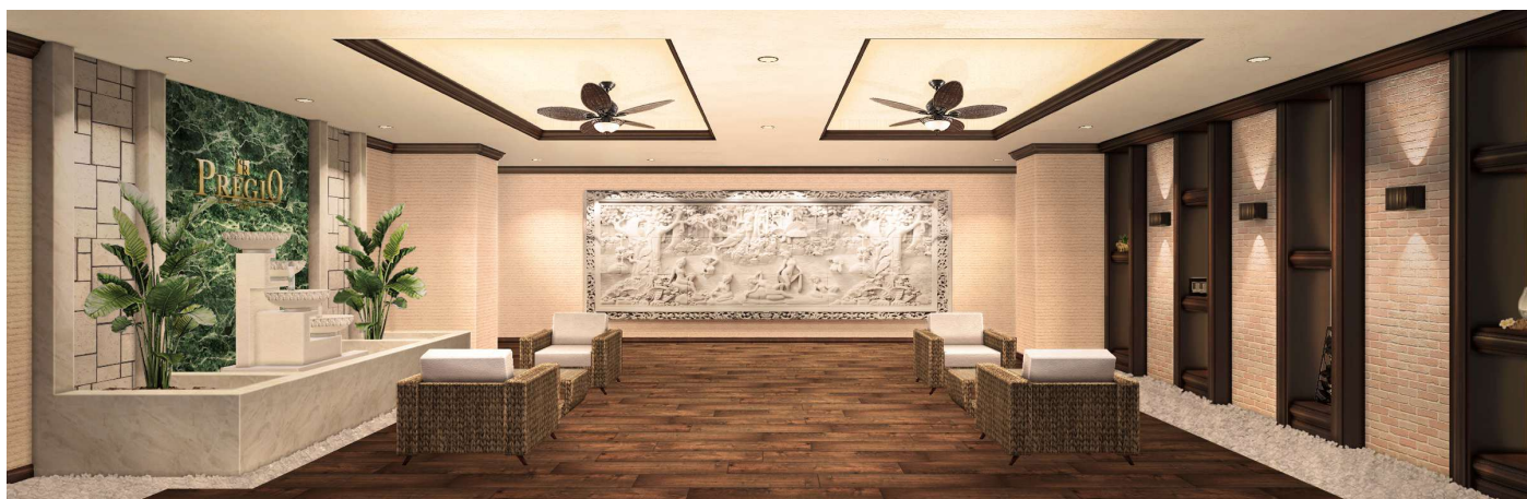
【エントランスホール イメージパース】

エントランスホールは、リゾートホテルのような優雅さと落ち着きを兼ね備えた迎賓空間です。正面にはバリ島の職人が手彫りで仕上げた繊細なストーンカービングを配し、異国情緒あふれる芸術的な空間を演出しています。木目調の素材と柔らかな間接照明、そして水のせせらぎを感じさせるオブジェが調和し、住まう人を日常の喧騒から解放し、安らぎに満ちた空間を創出しています。