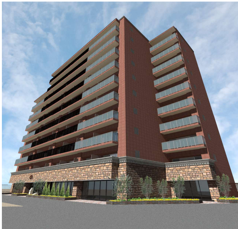
【外観 イメージパース】

最寄り駅は、JR 中央・総武線「平井」駅で、物件までは徒歩約7分の距離に位置しています。「錦糸町」駅まで約5分、「秋葉原」駅まで約11分、「東京」駅まで約16分、「新宿」駅まで約24分と、都心主要拠点への優れたアクセス性を誇ります。周辺は、荒川と旧中川に挟まれた自然豊かな環境でありながら、駅周辺には商店街やスーパーなど生活利便施設が充実しています。閑静な住宅街の中に公園や学校も点在し、落ち着きのある住環境と都市の利便性が調和した立地です。