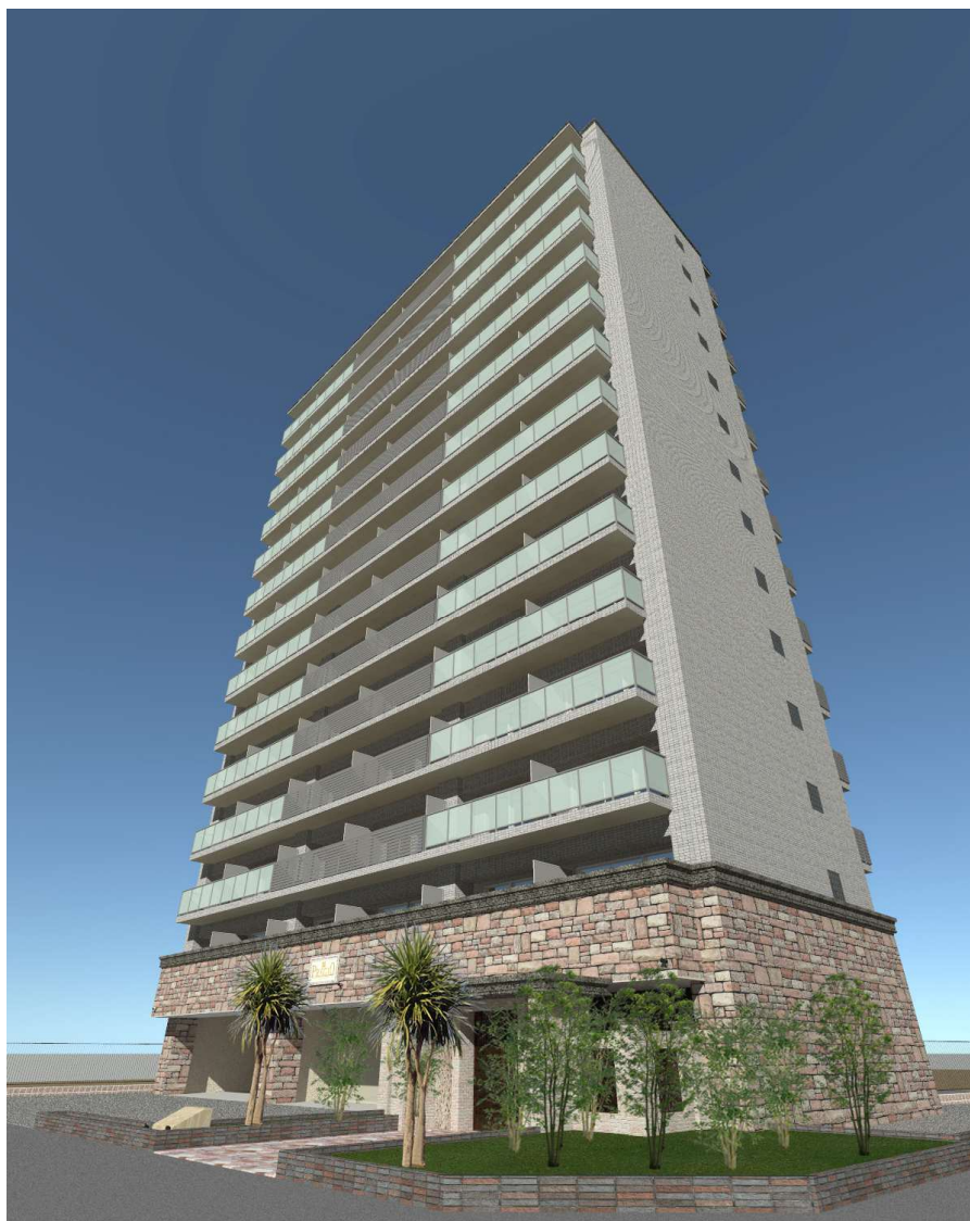
【外観 イメージパース】

当物件の最寄りである「布施」駅は近鉄大阪線と奈良線が交差する東大阪市の交通拠点です。近鉄奈良線を利用すれば「大阪難波」駅まで約 9 分という早さでアクセスが可能であり、通勤や買い物に、大変便利な立地です。また、駅周辺には商業施設や飲食店が充実しており、利便性の高いエリアとなっております。