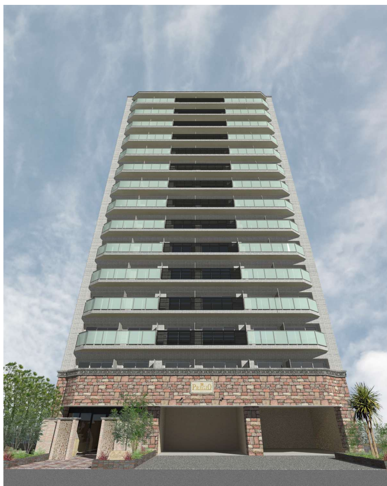
【外観 イメージパース】

当物件の最寄りである阪神本線・なんば線「尼崎」駅は、大阪梅田・大阪難波・神戸三宮といった主要エリアへスムーズにアクセスできる、関西圏屈指の交通の要所です。快速急行の利用で難波へ約 20 分、神戸方面へも快適に移動でき、通勤・通学から休日のショッピングまで多彩なシーンを軽やかにサポートします。さらに、なんば線と本線の接続により、大阪・神戸・奈良を結ぶ広域ネットワークが形成され、乗換えの手間を減らしたスマートな移動が叶います。複数路線が交差する利便性の高さに加え、周辺には商業施設や公共施設が集積し、日々の暮らしを快適に支える環境が整っています。都市の躍動を身近に感じながらも、落ち着いた住環境を享受できる、魅力的なロケーションです。