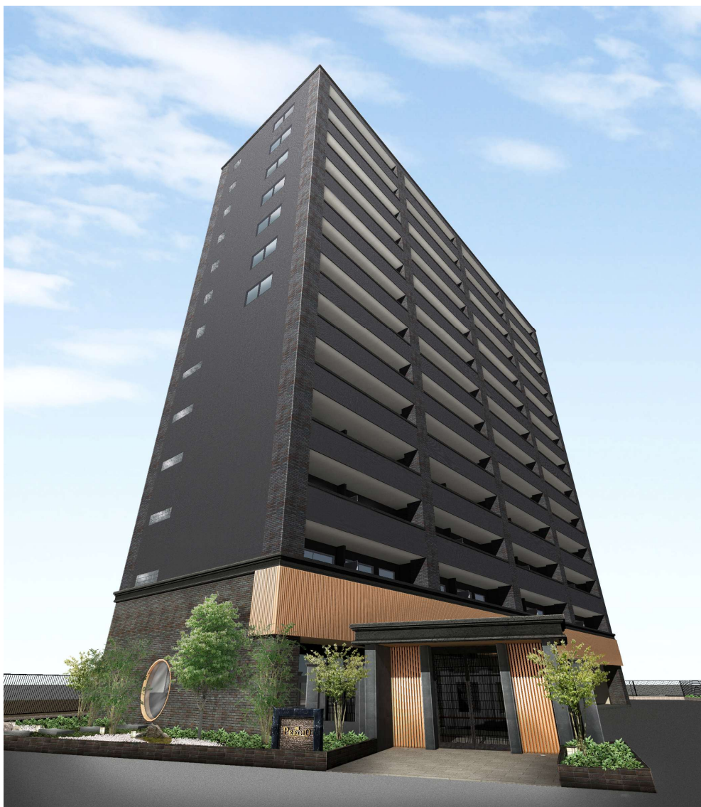
【外観 イメージパース】

当物件の最寄りである Osaka Metro 御堂筋線「東三国」駅は、「新大阪」駅へわずか 1 駅、梅田・心斎橋・なんばといった大阪の主要エリアへも直結しており、通勤・通学、週末のレジャーまで快適に移動が可能です。新幹線や各種在来線への乗り換えも自在なため、出張や旅行が多い方にも大変便利な立地です。都市生活の利便性を日常的に感じられる点が、東三国駅エリア最大の魅力です。