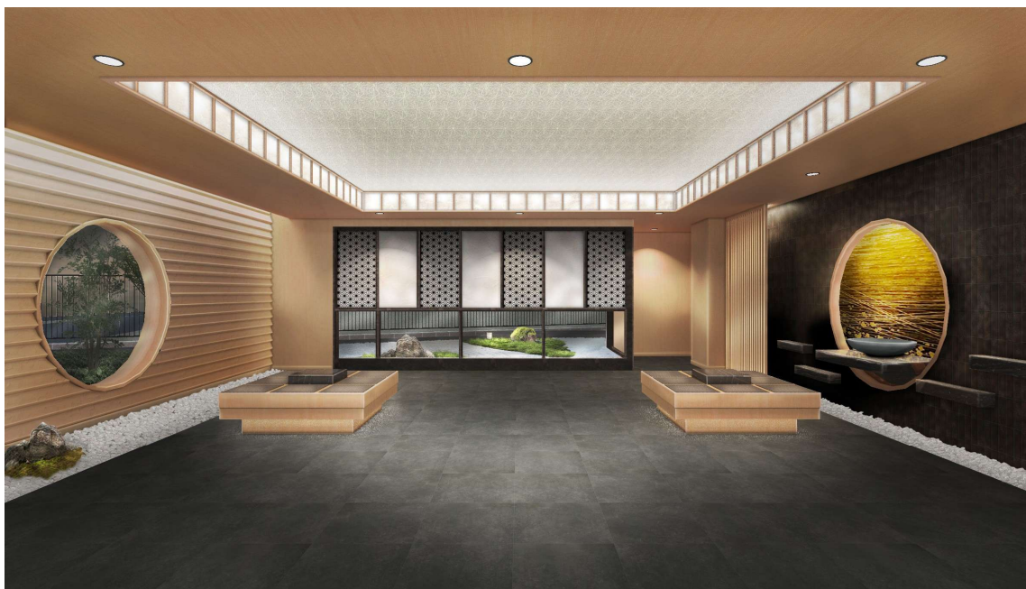
【エントランスホール イメージパース】

都会的なブラックトーンを基調に、繊細な素材感を纏わせたファサードは、住まう人の上質な日常を静かに引き立てます。アプローチには、豊かな植栽と趣ある意匠を配置し、四季の移ろいを身近に感じられる落ち着いた空間を演出。アプローチへと歩みを進めるそのひとときも、自然と心が解きほぐされるような、深い安心感に包まれます。伝統的な和の要素と、現代的なデザインを巧みに融合させたこの住まいは、“シンプルでありながら豊か”という美意識を追求した、これからの都市生活の新しいスタンダードです。