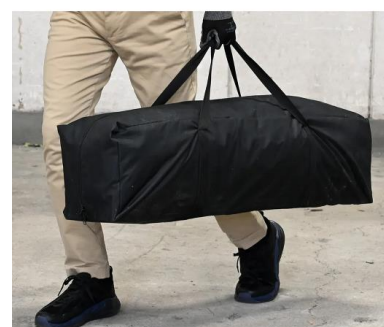
持ち運びしやすいキャリーバッグ付き