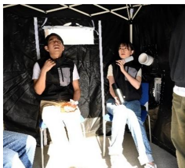
屋外用 180 cmタイプ使用イメージ