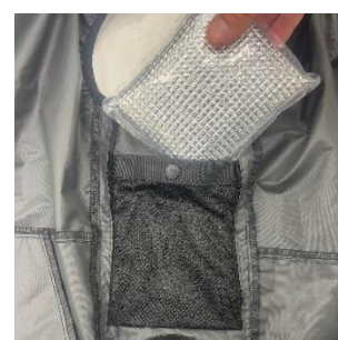
脇下を直接冷やすための 「保冷剤ポケット」