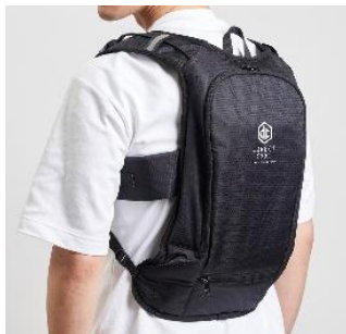
1. 水冷服 DIRECT COOL ProPLUS

このような背景から、当社では、現場を“面”でサポートする「熱中症対策アイテム」を展開しています。今回は、当社が運営するインターネット通販サイト「山善Bizコム」の店長が厳選した、今すぐ導入可能な猛暑対策アイテム3選をご紹介します。