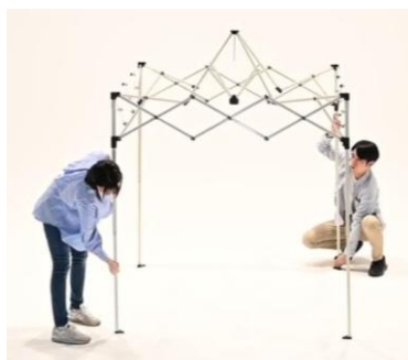
簡単に設営・撤収が可能