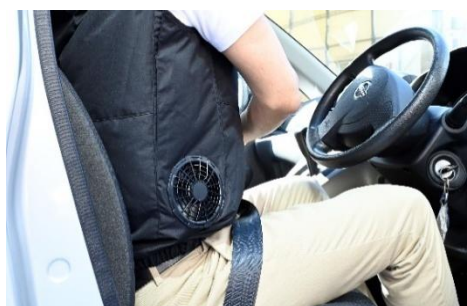
運転中も邪魔にならない「サイドファン」