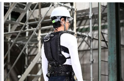
薄型なので、水冷服の上にハーネスを着用することが可能