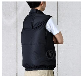
2. ファン付きウェア KAZEfit