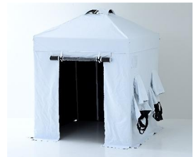
3. 熱中対策シェルター（屋外用）