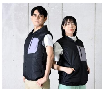
S～5L まで幅広い サイズをラインアップ