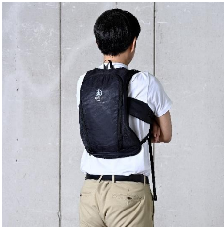
DIRECT COOL ProPLUS 水路式

株式会社山善(本社:大阪市西区/代表取締役社長:岸田貢司)は、水冷服「DIRECT COOL」シリーズの新モデル「DIRECT COOL ProPLUS (ダイレクトクール プロプラス) 水路式」を開発。本商品は、従来のチューブ式から背中を面で冷却する「水路式構造」へと進化し、より効率かつ快適な冷却性能を実現しています。当社が運営するインターネット通販サイト「山善ビズコム」やECモール「くらしのeショップ」、並びに一部ホームセンターなどで、2026年5月中旬から順次発売いたします。また、水を入れて使用する気化熱冷却ベスト「Mizu fit」も今年3月末から発売中です。