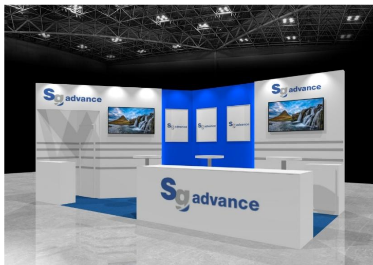
出展ブースイメージ