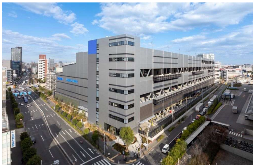
SG リアルティ新砂の全景