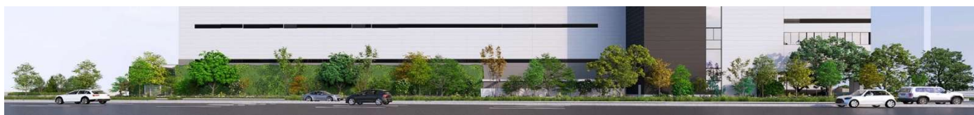
明治通り側緑化イメージ

本施設では、永代通り側エントランスの正面外観を円形の壁面緑化で特徴づけました。明治通り側では外壁低層部壁面緑化と、歩道に沿った外構エリアの植栽を充実させることで、都市の中でも自然を感じられる空間を形成しました。多様な中高木を配置することで森林浴を楽しめる環境を整え、照明計画により夜間でも温かみのある表情豊かな空間を実現し、地域環境への貢献を図っています。