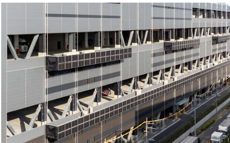
バルコニー（壁面）の太陽光パネル

本施設では、屋根面に自家消費型太陽光発電設備を設置し、再生可能エネルギーの活用を通じて持続可能な社会の実現に貢献します。さらに、SG リアルティとして初の取り組みとなるバルコニー（壁面）への太陽光パネル設置を行っており、これにより年間約 341MWh の発電量が見込まれ、施設運営におけるエネルギー効率の向上に寄与します。加えて、これらの取り組みにより環境負荷の低減も図っています。