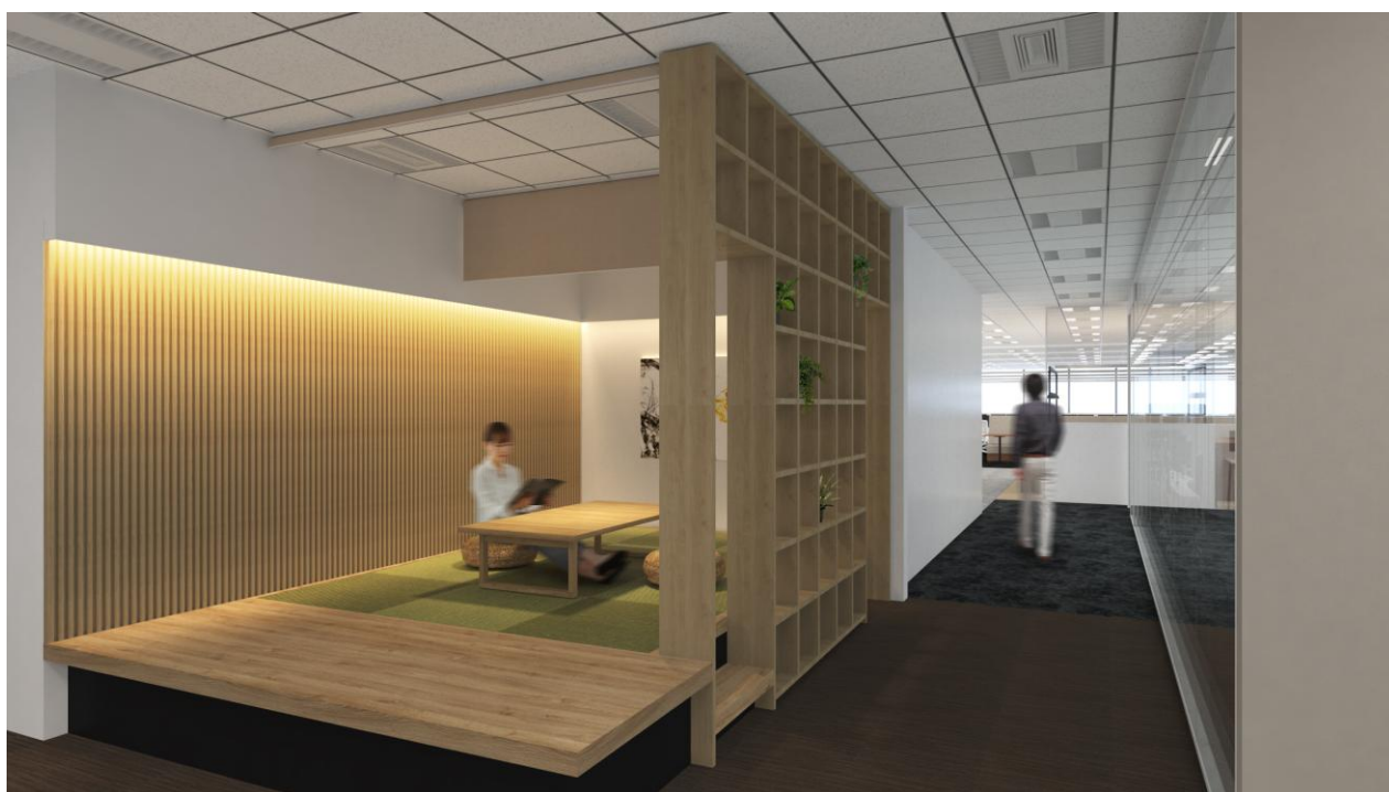
ととのえ処（お祈りと休息）