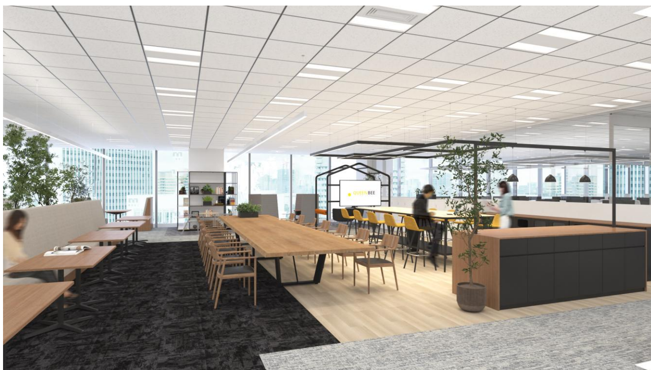
リフレッシュエリア