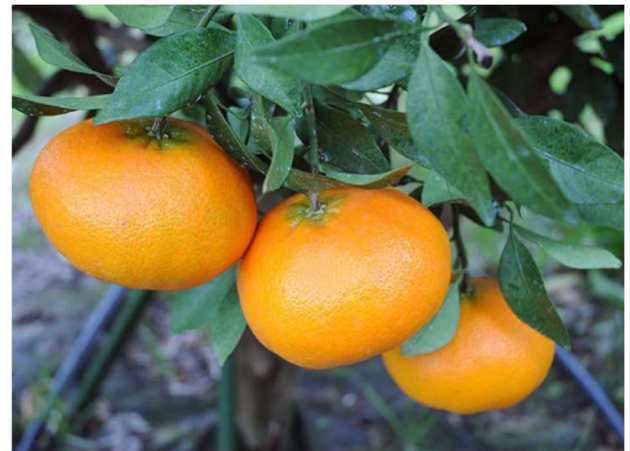
「愛媛かんきつフェア」で販売予定の愛媛オリジナル品種「甘平」