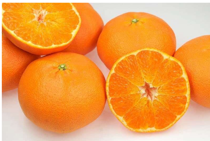
プレゼントで選べる 愛媛県オリジナル品種の「甘平」

愛媛県は、愛媛県産かんきつ 5,000 円相当をプレゼントするキャンペーンを 2022 年 12 月 31 日（土）まで実施しています。期間中に「愛媛かんきつ部 Instagram」（ https://www.instagram.com/ehime.kankitsu_club/ ）をフォローの上、愛媛の魅力や愛媛県産かんきつに関する写真や動画に「#えひめシトラスフライト」※ 1 を付けてインスタグラムに投稿いただいた方を対象に、愛媛県が誇るオリジナルブランドの「甘平」や「せとか」などを抽選で 100 名様にプレゼントします。