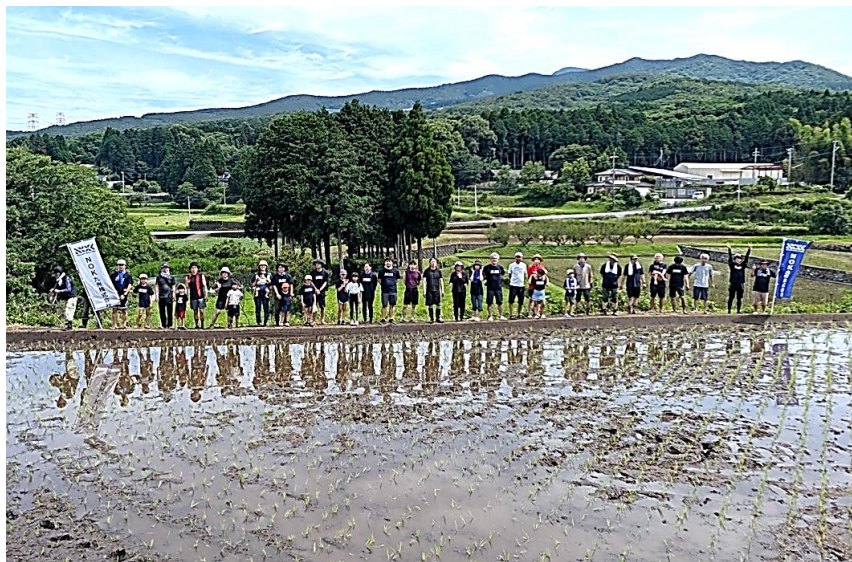
2026年度「水田オーナー制度」田植えの参加者

「水田オーナー制度」は、水田を持つ生産者と、オーナーとなる協賛企業・団体・個人が共に米作りをすることで、雨や水を地中に浸透させる水田を守り、地下水を育む「かん養」※1につなげる取り組みです。