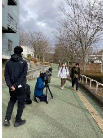
福島大学取材時の様子