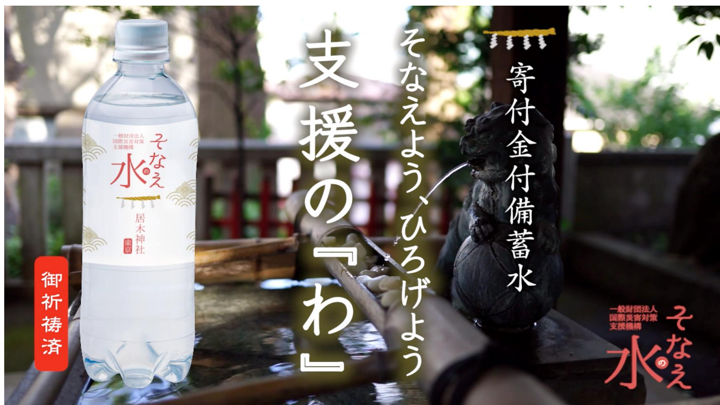
居木神社での設置の様子

2022年7月5日より、一般財団法人国際災害対策支援機構は「そなえの水」の趣旨に賛同いただいた「居木神社」「下神明天祖神社」「蛇窪神社」「戸越八幡神社」「駒繫神社」の5神社にて、そなえの水の設置、災害対応型自動販売機での販売を開始いたしました。