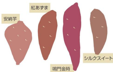
さまざまな品種でも焼けます