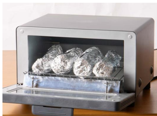
焼き芋をたくさん焼けます