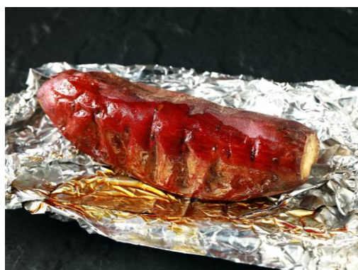
簡単にこの蜜たっぷり焼き芋が焼ける！

第3世代となるG2モデルでは、より幅広い品種に対応する構造や、専用ケース不要の使いやすい設計へと進化。今回の新色ブラックは、ユーザーの声とキッチン家電のトレンドを踏まえ、より多くの家庭で使われるデザインを目指して追加されました。