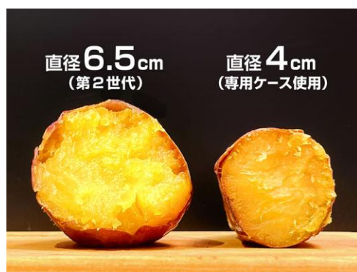
G2（第3世代）は太い芋もしっかり甘く焼けます