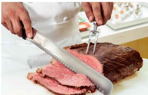
(左上・左下) ご自身でお作りいただけるハンバーガー、ミニパフェ (右上) 綿あめ、(右下) ローストビーフ