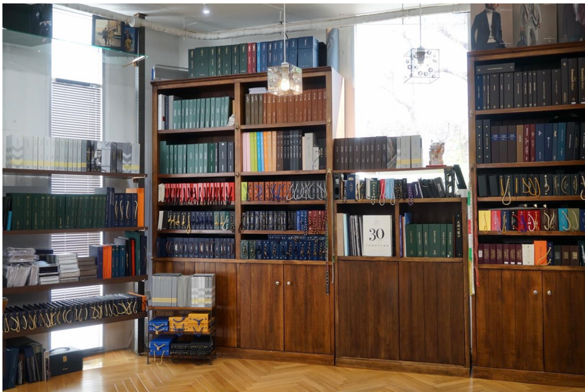
TAGARU 生地見本バンチブック棚