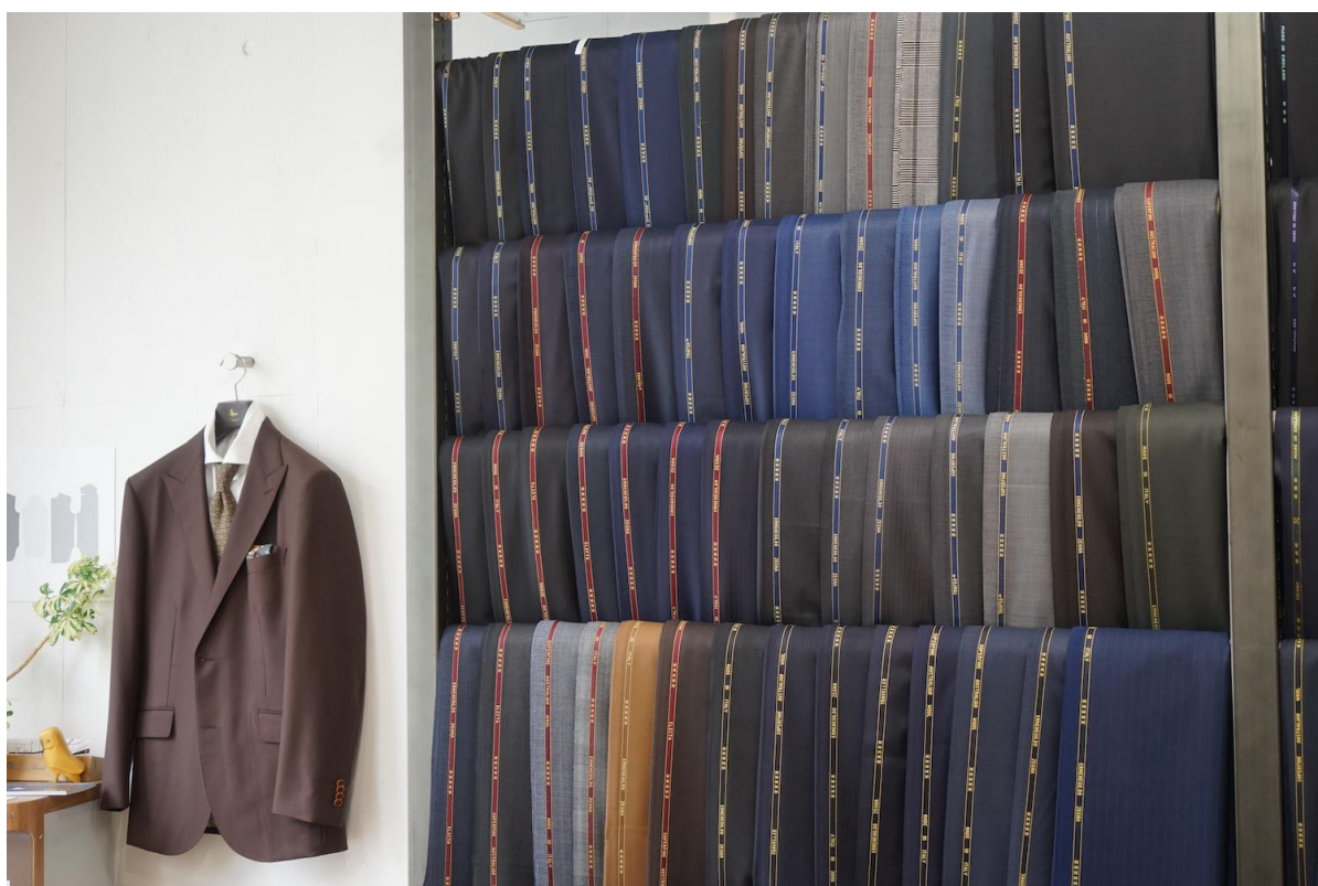
スーツの着分生地からお得にオーダー