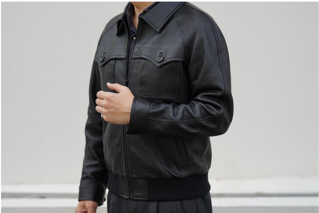
オーダーブルゾンラムレザー

これまでも数多くのドラマや映画への衣装協力や提供をはじめ、世界的な時計ブランドや大手ホテルのユニフォーム製作など、多様なオーダーに携わってきました。代官山・恵比寿・表参道で培ってきた提案力と感性を活かし、対面ならではの丁寧なカウンセリングを通して、お客様一人ひとりに最適な一着をご提案いたします。