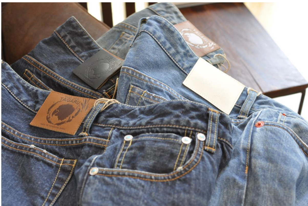
本場倉敷のオーダージーンズ