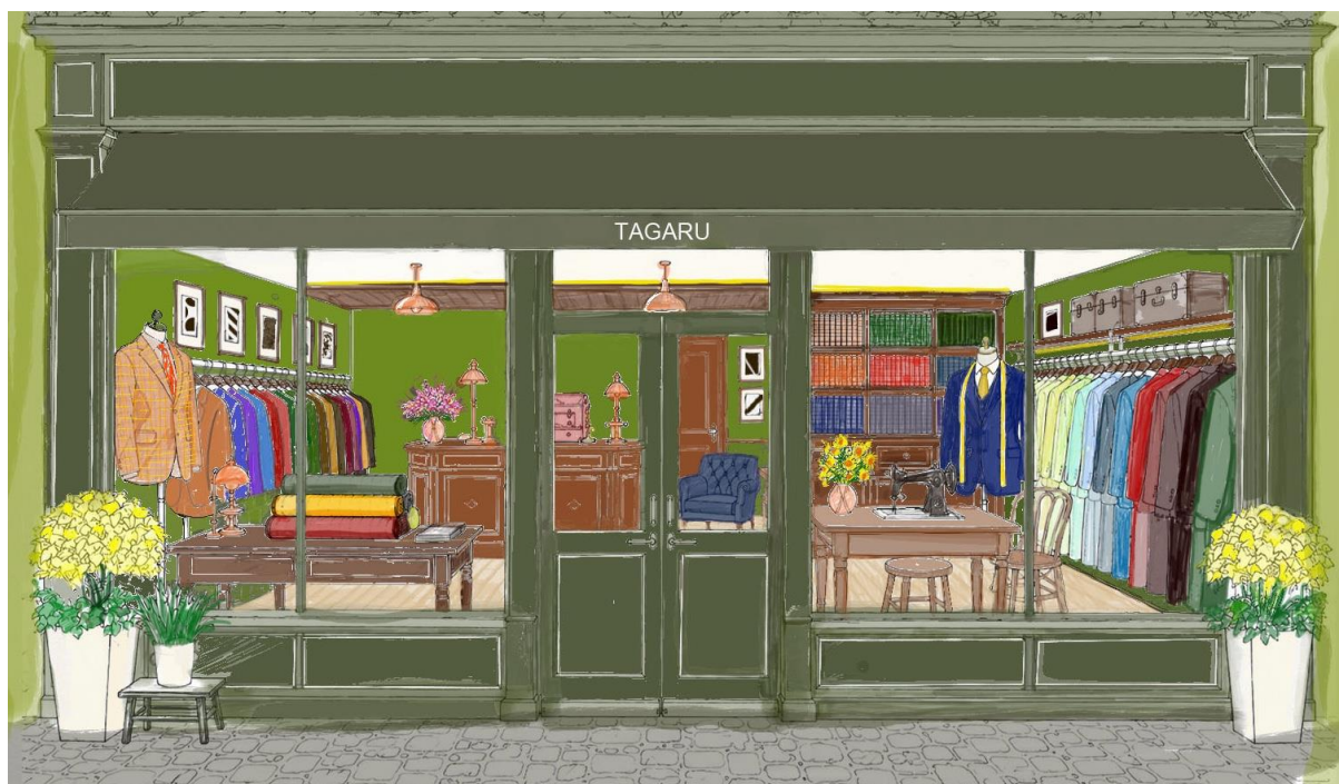
TAGARU 新代官山店外観イメージ

オーダーメイド専門店『TAGARU』が、代官山の旗艦店を移転&リニューアルオープン