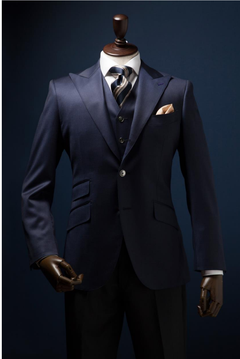
TAGARU のオーダースーツ

「ただのスーツじゃつまらない それを身に纏う事で内側からこみ上げる躍動感」をコンセプトにこれまで 16 年間築き上げてきました。 TAGARU はこれからも、「服を買う」のではなく「一緒につくる楽しさ」を大切にしながら、一人ひとりの「理想を仕立てる」オーダーメイドブランドとして、新たな価値を創造し続けてまいります。