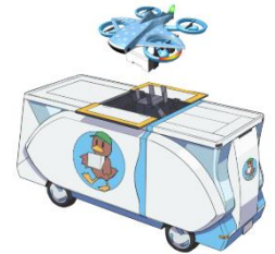
【未来テクノロジー】 ドローンポートトラック

■物流 ～どこへでも届く、誰にでも届く。～ 人口減少に悩む地域では、ドライバー不足や買い物難民といった課題が大きくなります。必要な時に必要なものを手に入れられる、暮らしに寄り添う物流が重要です。