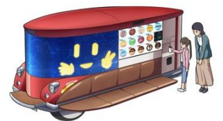
© 2022 KYOCERA Corporation 【未来テクノロジー】 無人移動店舗

■流通 ～売る人も買う人も嬉しい仕組み。～ 人口減少や少子高齢化は、流通機能や生産者の販売網の弱体化につながります。地方でも生産者と消費者と適切につなげるサステナブルな流通が地域を元気にします。