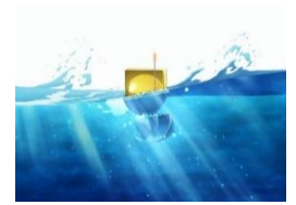
© 2022 KYOCERA Corporation 【未来テクノロジー】 エナジーハーベスト型 スマートブイ

■漁業 ～漁業の魅力、技術で引き出す。～ 地方の漁業は労働力不足、後継者不足や収益性の低下などが予想されます。未来に向け、誰もが漁業に取り組むことの出来る仕組み作りで、働く魅力に溢れた豊かな漁業の姿を目指します。