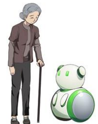
© 2022 KYOCERA Corporation 【未来テクノロジー】 散歩付き添いロボット

■コミュニケーション ～近くで支え、遠くで見守る。～ 少子高齢化で増える一人暮らしの高齢者が住み慣れたまちで過ごせるように、遠隔地の家族とのコミュニケーション、健康管理や遠隔医療など心身のサポート技術を身近にします。