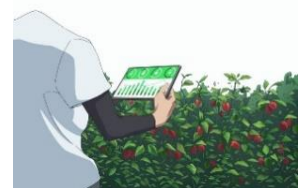
© 2022 KYOCERA Corporation 【未来テクノロジー】 スマート農業

■農業 ～匠の技を、みんなの技に。～ 少子高齢化による人手不足・後継者不足に加え、匠の技も失われます。さらなる省人化・効率化と農業技術が承継できる仕組みで、誰もが簡単に取り組める未来をつくります。