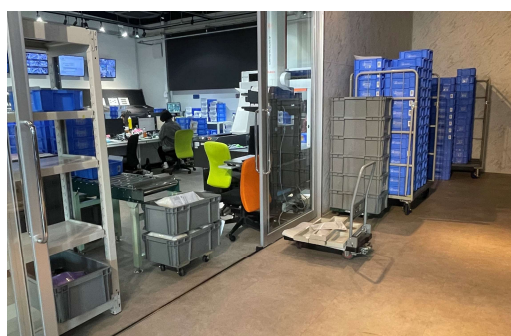
<立体自動倉庫導入前：点在する通い箱たち>