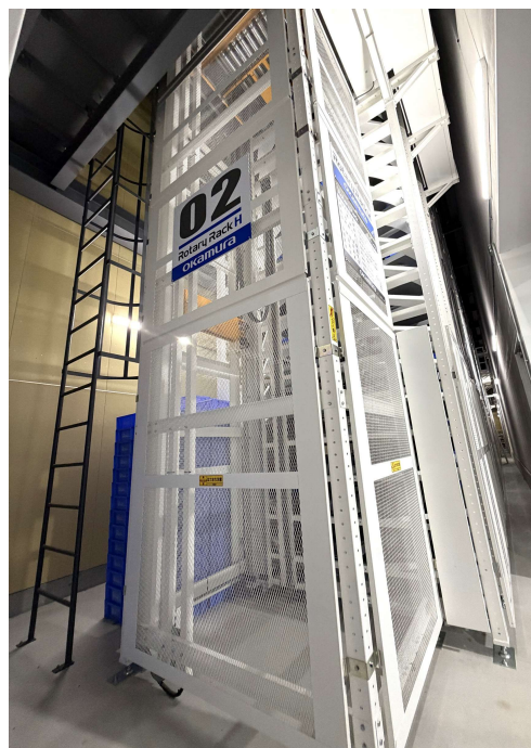
<常滑工場の立体自動倉庫>