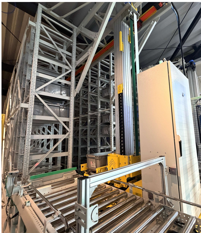
<立体自動倉庫導入後：きれいに収まる通い箱たち>