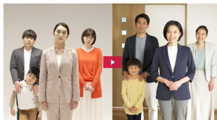
戸建て住宅販売編

https://m-arch-log.com/?ID=housingsalesmovie