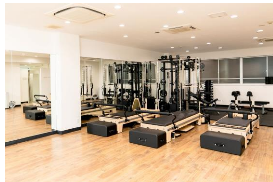
充実したピラティス・ウェイトトレーニング設備

「Sportip Pro」とカウンセリングの情報は、電子カルテとして随時、参照できます。例えばレッスンの Before・After でデータを呼び出し、体の変化を視覚的にわかりやすく把握できます。専門的な知識がなくても、自身の体をより深く理解しながら理想の状態に近づいていくことができます。レッスンメニューは、プライベート/セミプライベート（2名）/グループの3タイプ。料金は月額 9,480円（税込）～。チケット制も選べます。