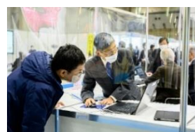
新価値創造展 2021 のコンシェルジュ相談の風景

事業のプロが企業と企業をつなぐコンシェルジュ相談を実施。リアル展では対面で、オンライン展ではオンラインコンシェルジュがサポートします。