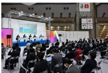
新価値創造展 2021 のメインステージセミナーの様子