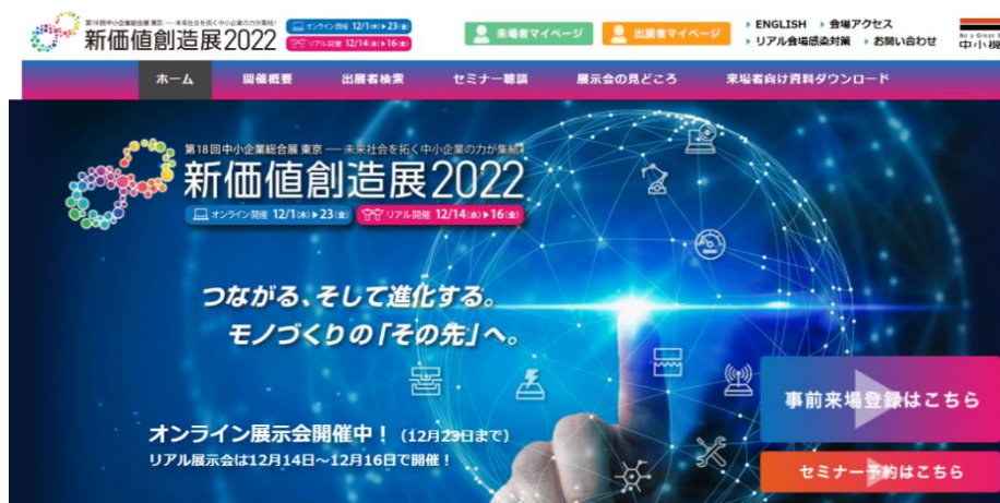
新価値創造展 2022 公式ウェブサイトのトップ画面