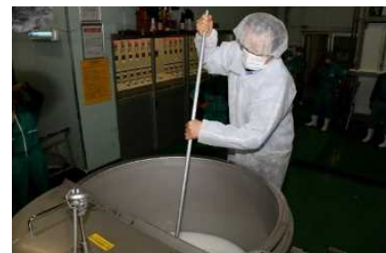
醸造参加（岡村市長）