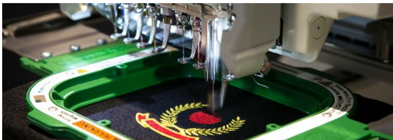
タジマブランド刺繍機稼働イメージ

この度の TSS 社設立により、タジマグループはハードウェア・ソフトウェア双方に対して、各社のノウハウを融合し、さらに高度な製品開発・販売・アフターサービスを実現することが可能になりました。刺繍業界初の総合ソリューション企業として、当社はお客様へのさらなるサービス向上に努めてまいります。