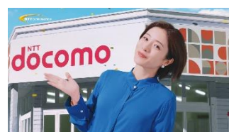
【石原さん】 さあ、今すぐ ドコモショップへ