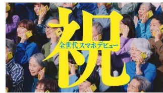
【石原さん】 祝！全世代スマホデビュー