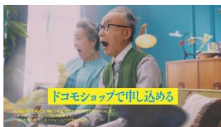
【ナレーション】 ドコモショップで 申し込める