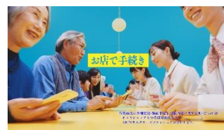
【ナレーション】 お店で相談しながら、 手続きできるから