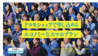
【ナレーション】 ドコモショップで申し込める エコミーな スマホプランは、