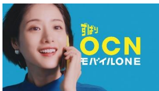
【ナレーション】 それは…