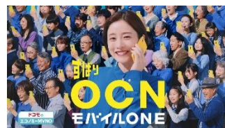
【石原さん】 やっぱり、OCN！