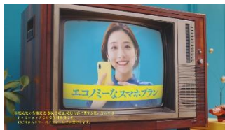
エコミーな スマホプラン