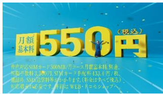
【石原さん】 月額基本料は、 なんと 550 円！