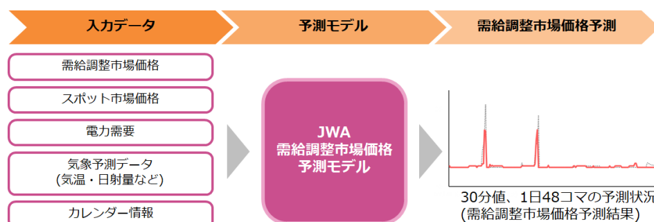
「需給調整市場価格予測」の概要

卸電力取引市場(JEPX (注6) が運営)を対象とした「スポット市場価格予測」と組み合わせることで、需給調整市場の落札価格予測が前日スポット市場価格予測より高いときに需給調整市場に入札するなど、売電先市場を選択される際のご判断にお役立ていただけます。また、蓄電所事業者による系統用蓄電池の売電収益の最大化、リソースアグリゲーター (注7) による売電計画策定を支援します。今後は一次調整力・二次調整力①②・三次調整力①にも対応し、さらなる機能拡充を予定しています。