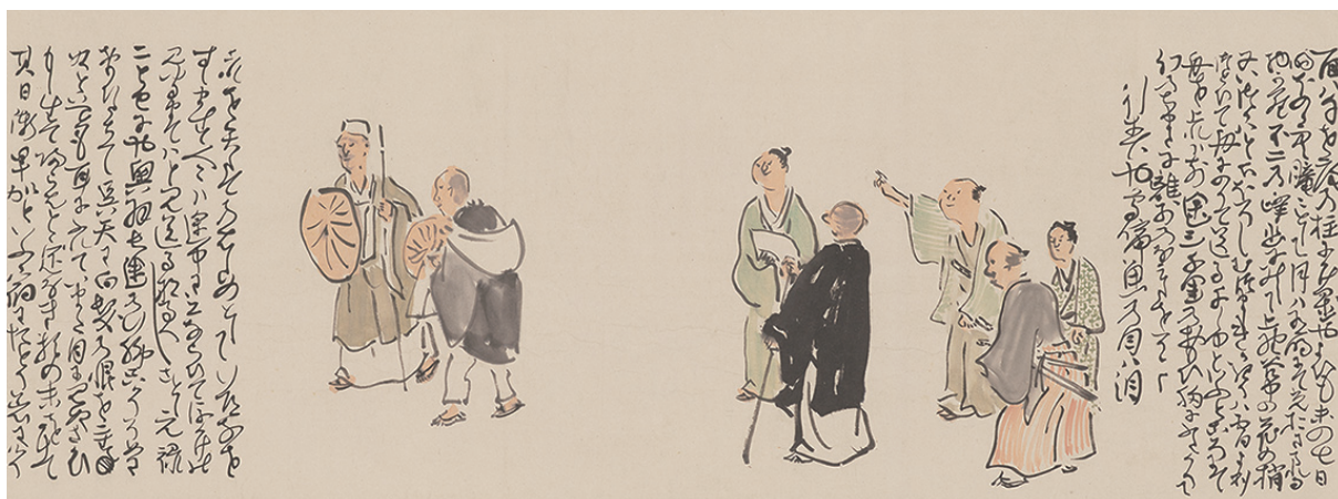
重要文化財 奥の細道画卷 与謝蕪村 二巻のうち 安永8年(1779) 【通期・巻替あり】

江戸時代の与謝蕪村(1716~1783)と呉春(1752~1811)の作品群は、俳諧を趣味とした逸翁のコレクションの中核として、充実した内容を備えています。俳諧の名手であった蕪村にとって、五七五の俳句に簡略で洒脱な絵を添えた〈俳画〉は、第一人者として自負も抱いていたジャンルです。なかでも「花見句画賛」「石画賛」は蕪村自らの俳句と文字、絵の魅力がみごとに融合した優品です。また「奥の細道画卷」は蕪村が敬愛してやまない松尾芭蕉の紀行文『奥の細道』を絵入りで写した俳画の集大成というべき代表的作品です。今回は会期中巻替えをしながら全巻をご覧ください。貴重な機会となります。