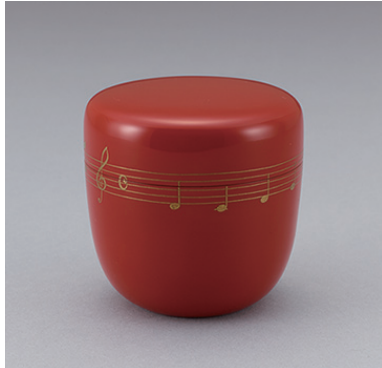
朱地君が代楽譜蒔絵棗 兪好齋好 三砂良哉 一合 昭和時代 20世紀 【通期】