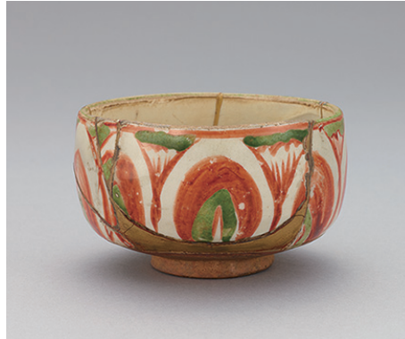
五彩蓮華文呼継茶碗 逸翁銘「家光公」 一口 元時代 13世紀 【通期】