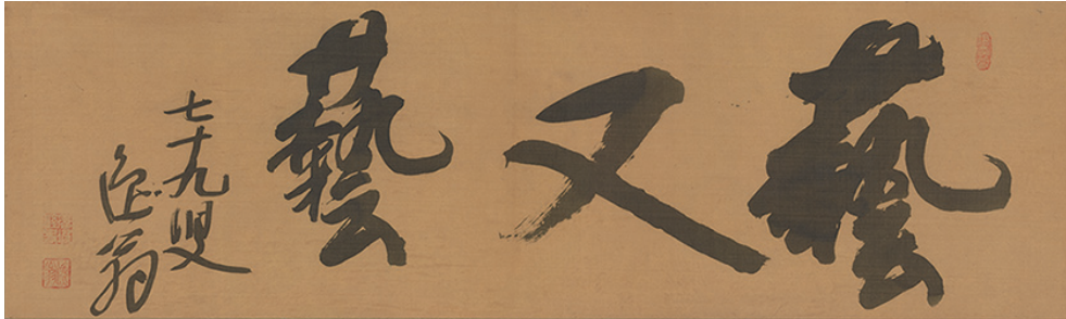
扁額「藝又藝」 小林一三 昭和時代 20世紀 【通期】