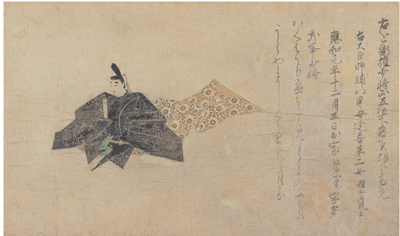
(右)重要文化財 佐竹本三十六歌仙切 藤原高光 伝 藤原信実画・伝 後京極良経詞書 一幅 鎌倉時代 13世紀 【後期】 (左)石山切 伊勢集「ぬきためて」 伝 藤原公任 一幅 平安時代 12世紀 【前期】

古筆切 こひつぎれ とは古人の優れた筆跡の巻物や冊子から一部分を切りとった断簡のことをいいます。多くは鑑賞のために掛軸に表装され、あるいは手鑑・屏風に貼られ大切にされてきました。逸翁美術館は伝 小野道風筆の「継色紙」など、平安・鎌倉時代にさかのぼる古筆切を多数収蔵しています。『谷水帖』は、近代数寄者である鈍翁(益田孝)が、所蔵した古筆二十四葉を手鑑に仕立てたもので、「石山切」「高野切」に代表されるように、優美な仮名文字や華麗な料紙装飾が見どころです。貴重な「佐竹本三十六歌仙絵巻」は、大正8年(1919)に一歌仙ごとに分割され、逸翁は「藤原高光」を入手しています。さらには「楞伽経」 りょうがきょう 「目無経(白描絵料紙金光明経)」 めなしきょう 「十卷抄」 じっかんしやう などの経典・経巻類も充実しており、逸翁コレクションの格調の高さを物語っています。