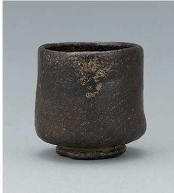
黒樂筒茶碗 惺齋追銘「老松」 樂長次郎 一口 桃山時代 16世紀 【通期】