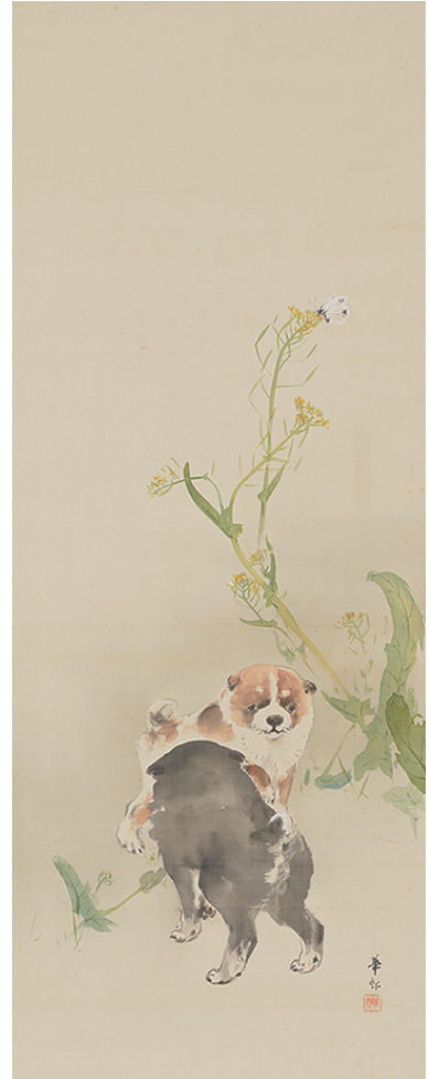
菜花狗児図 鈴木華邨 一幅 明治39年(1906) 【前期】

「黒地歌劇雛祭楽譜蒔絵棗」は、棗の蓋と身の合わせの部分に逸翁自作の歌劇「雛祭」の楽譜を蒔絵の意匠として施したもので、宝塚歌劇二十周年の記念茶会で用いるために逸翁が良哉に作らせた独創的な茶道具です。他にも、北大路魯山人(1883～1959)や河井寛次郎(1890～1966)、与謝野晶子(1878～1942)などの作品における制作経緯には逸翁との交流を物語るエピソードが知られており注目されます。