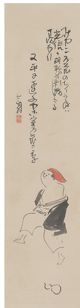
花見句画賛 与謝蕪村 一幅 江戸時代 18世紀 【後期】

蕪村の弟子であった呉春(松村月溪)は、逸翁美術館のある池田 くれは (呉服の里)に一時期住んでいたというゆかりも深い人物でした。蕪村の没後には円山応挙のもとで画作をするようになり、「松下游鯉図」「岩上孔雀図」には応挙の写生画風の影響がうかがわれます。呉春が描いた「白梅図屏風」は逸翁美術館を代表する屈指の名品です。夜の情景を暗示するごとく藍色に染められた特殊な背景に、白い花を咲かせた梅の枝が闇から浮かび上がるような画面に静かに向き合うと、呉春の師であった蕪村の辞世の句「白梅に明くる夜ばかりとなりにけり」が自ずと念頭に浮かんでいきます。他にも円山四条派に連なる長沢芦雪、松村景文や、谷文晁、森狙仙などの個性豊かな絵師たちによる江戸絵画の競演も見どころとなっています。