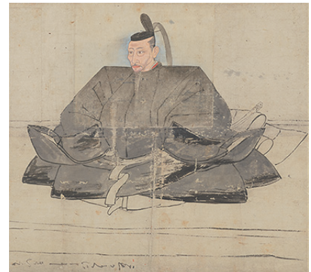
重要文化財 豊臣秀吉画像 狩野光信 一幅 桃山時代 16世紀 【前期】

逸翁が収集したコレクションには、鎌倉時代の「地藏十王像」や室町時代の稚児物語を絵画化した「芦引絵」のように、仏画や絵巻、奈良絵本においても優品が含まれています。豊臣秀吉(1537～1598)の面貌をとらえた「豊臣秀吉画像」には「これがよくに(似)申よしきい(貴意)にて候」との書入れがあり、没後に多数制作された「豊国大明神画像」の元となった貴重な画稿です。ほぼ同時代の「三十三間堂通矢図屏風」や「露殿物語絵巻」では近世初期における人々の生活風俗がいきいきと描写されています。