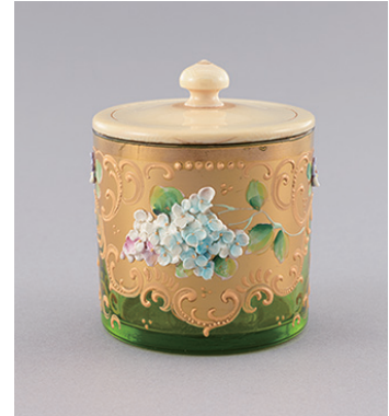
草花文緑ガラス小壺(茶器) イタリア 一口 18世紀 【通期】

逸翁は、実業家としても茶人としても、松永安左エ門(雅号・耳庵 じあん 1875～1971)や五島慶太(雅号・古経楼 こきょうろう 1882～1959)などと深い交友を結び、茶会をひらいては自慢の道具の取り合せを共に楽しみました。茶入、茶碗、花入、水指といった逸翁美術館が所蔵する茶道具は、いずれも逸翁の審美眼によって選ばれ、好んで茶会に使用された器ばかりです。なかには「五彩蓮華文呼継茶碗」における逸翁銘「家光公」のように逸翁が自ら銘を付けた茶碗も少なくありません。逸翁は旧来の伝統にとらわれることなく椅子席の茶室を設けたり、外遊の際には積極的に西洋の陶磁器やガラス器を入手して持ち帰り、茶器に見立てて茶会に転用したりしてみせました。セーヴル窯の「赤地金欄手写花鳥文壺(水指)」や、「草花文緑ガラス小壺(茶器)」はその代表的な例であり、逸翁コレクションに華やかな彩りを添えています。さらに懐石料理に丼物や洋食を取り入れるなど創意工夫を試みており、新たな茶の湯の在り方を提案しました。