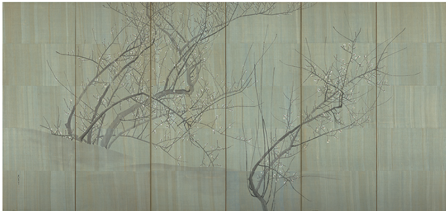
重要文化財 白梅図屏風 呉春 六曲一双 江戸時代 18世紀 【通期】