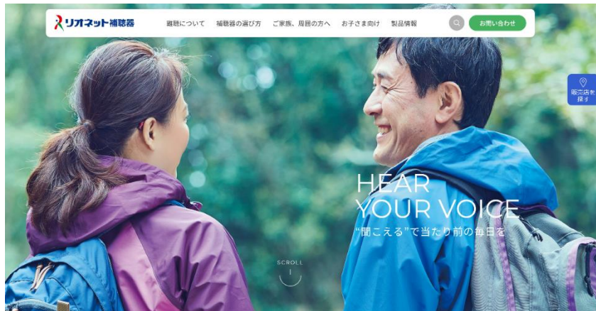
リオネット補聴器ブランドサイト TOP ページ