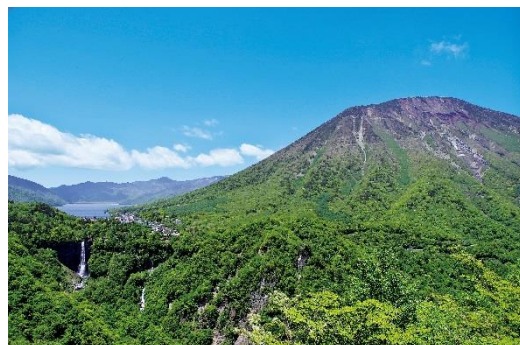
中禅寺湖、華厳の滝、男体山

栃木県は、訪日外国人含む年間約1200万人の観光客が訪れる世界遺産「日光東照宮」があり、四季折々の自然に包まれる絶景の「中禅寺湖」に、「鬼怒川温泉」「那須塩原温泉郷」や、関東有数のリゾート「那須高原」、全国から食べに来る「宇都宮餃子®」、など魅力がいっぱいです。そして、半世紀以上いちご生産日本一の座に輝く「いちご王国」でもあります。また、良質な水を使い、熟練された技で仕込んだ美酒を生み出す酒蔵が36ある関東の酒どころです。