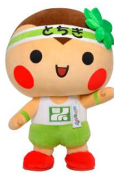
大田原市イメージ キャラクター 与一くん