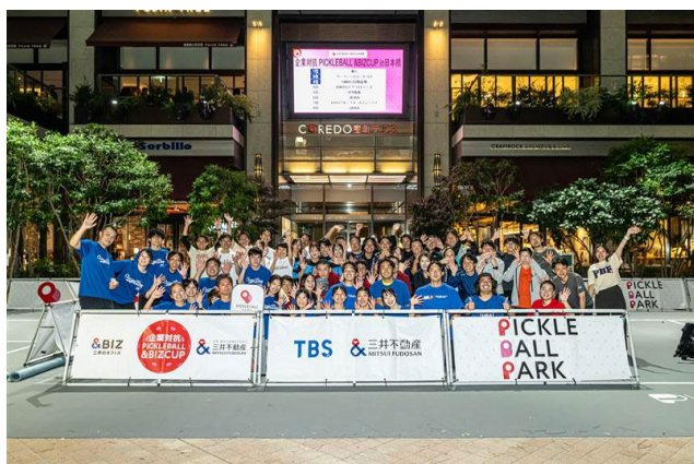
テナント企業向け参加型イベント「&BIZ event」 企業対抗ピククルボール大会「&BIZ CUP」開催の様子

三井のオフィスでは、&BIZを通じてワーカーの毎日をより豊かにし、テナント企業のパフォーマンスの最大化につながるサービス提供に取り組んでいます。