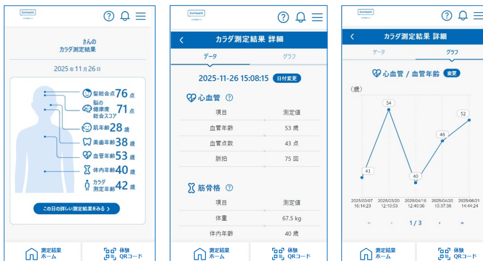
カラダ測定サービスに関するアプリケーションのイメージ

本サービスにおいては、継続的な利用によりユーザーの健康に関する意識変容・行動変容へつなげるとともに、日常生活における持続的な健康支援を実現します。オフィスワーカーが昼休みや業務の合間に利用し、日々の体調変化の把握や、結果の共有を通じた健康意識の醸成など、日常の中で継続的に活用されることを想定しています。また、コンディション管理を通じて生産性向上に資する活用も期待されます。