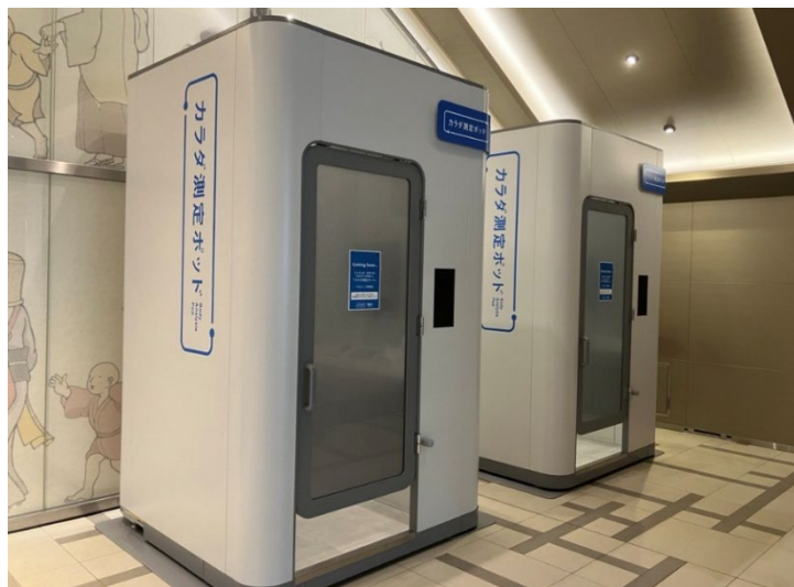
「カラダ測定ポッド」設置の様子(日本橋室町三井タワーB1階)

企業における健康経営や人的資本への関心の高まりを背景に、従業員のウェルビーイング向上に資する取り組みの重要性が増している中、今回の設置は、日本橋室町三井タワーおよび周辺オフィスに勤務するオフィスワーカーを主な対象とし、日常の中で健康状態を可視化できる環境を提供し、新しい健康習慣の創出を目指すものです。三井不動産は、オフィスワーカー向けサービス「&BIZ(アンドビズ)」の一環として、テナント企業の従業員の健康増進やウェルビーイング向上に資する取り組みとして本サービスを展開します。なお、本サービスは来街者にもご利用いただける環境とすることで、街全体への波及と新たなヘルスケア体験の定着を目指してまいります。