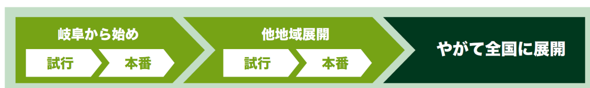
図 2 GDIの事業展開ビジョン