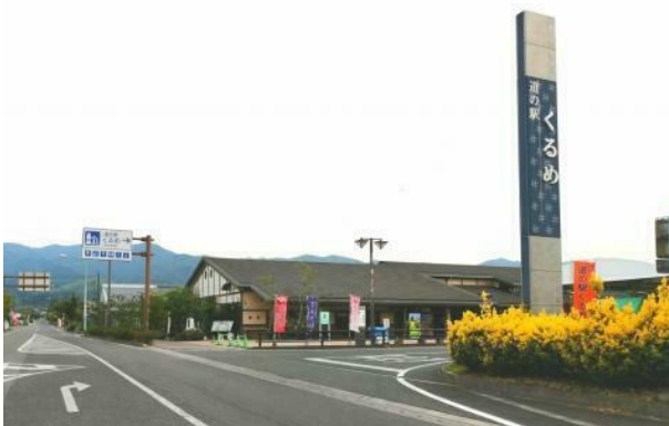
総合1位となった「道の駅 くるめ」