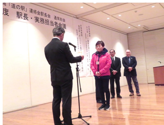
総合1位 道の駅くるめ 表彰状授与の様子