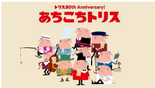
「あちこちトリス」プロジェクトキービジュアル

身近な場所やブランドとのコラボ施策など、1 年を通して「アンクルトリス」があちこちに出現し、何げない日々の中で、ポジティブな気持ちになっていただけるような施策を予定しています。