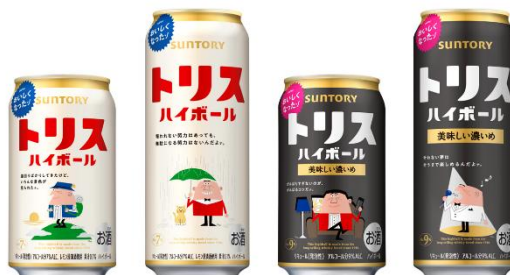
「トリスハイボール缶」パッケージデザイン第2弾

また、定番2種の「トリスハイボール缶」「トリスハイボール缶(美味しい濃いめ)」の350ml缶、500ml缶の新たなパッケージデザインとして、それぞれの表・裏に、気持ちが和むような「アंकフルトリス」の一言メッセージとイラストを全16種類展開いたします。5月下旬以降、新パッケージデザインへ順次切り替えいたします。