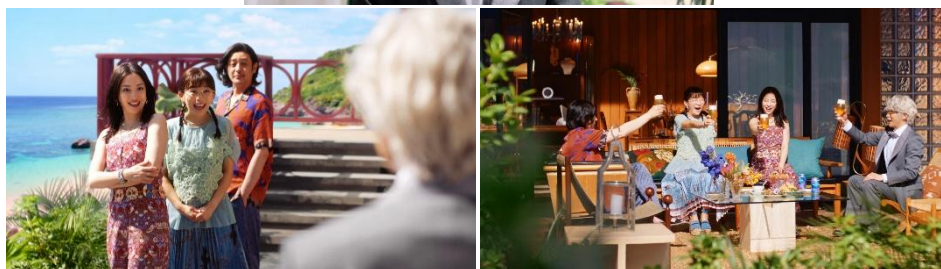
新 TV-CM ザ・プレミアム・モルツ〈ジャパニーズエール〉香るエール 『プレモル子ちゃん・ヒデじい登場』篇